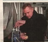
Et mikrobiologisk laboratorie, som venter sammen med et lokalsamfund