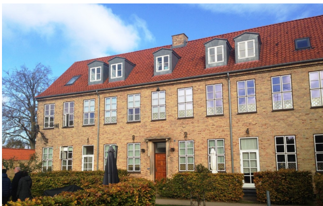
Bygmesterskolens vinduer skal renoveres. Ejerforeningen vil gøre det nænsomt. Bygmesterskolen er en Bedre Byggeskik-bygning.