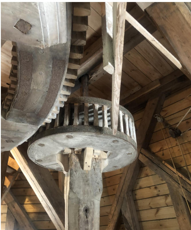
Del af stjernehjulet og det ene stokkedrev til en kværn, Nr. Jernløse Mølle