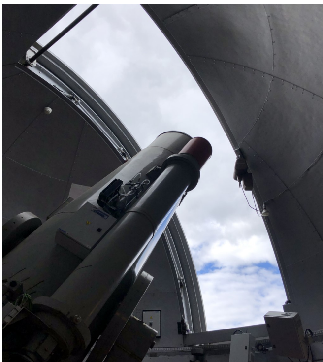
En af de store kikkerters i en af observatoriebygningerne i Brorfelde, som ejes af Holbæk Kommune

FBL-Holbæk vil arbejde på, at politikerne snarest får forelagt forslag til etableringen af et Arkitekturråd.