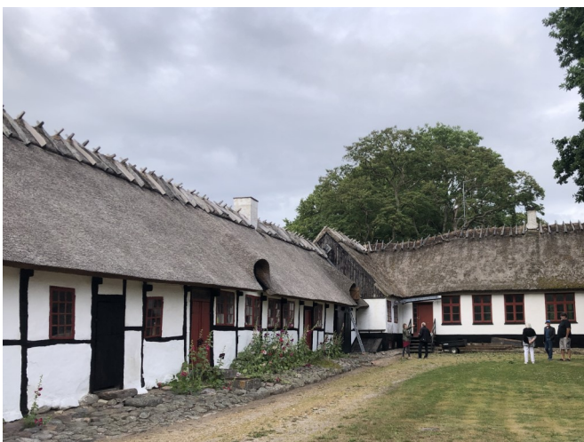
Alle Orø Præstegårds længer er nu sikret med den bevarende lokalplan

Bemærkningerne vedrører blandt andet fjernelse af overmalingen med murasfalt på soklerne af granit, præciseringer om vinduessprosser med kvartstaf og kitfals, nænsom placering af handicapadgang mv.