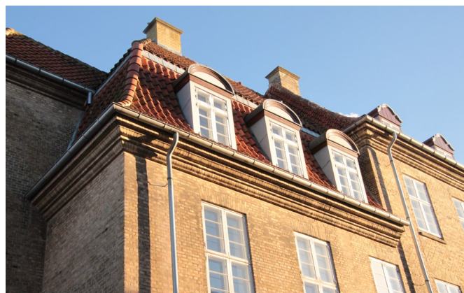
Udsnit af den flotte Kommandantbygning, som nu bliver SAVE-registreret med henblik på at få bevaringsværdien vurderet