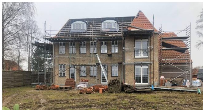
Møllevangen 1 i 2023 med alt for store kviste og alt for store døråbninger, som også sidder i siderne på den fremskudte bygning.

“FBL-Holbæk har det sidste halve års tid fået flere henvendelser angående Møllevangen 1 - hovedsagelig fra vores medlemmer. Henvendelserne drejer sig primært om ejeren har fået lov til at bygge som han gør, dernæst om FBL-Holbæk er blevet hørt i sagen. ... er byggeriet synligt fra nordsiden unægteligt blevet en del højere end den oprindelige bygning og forsynet med nogle store buede kviste jf. vedhæftede fotografi. Oprindeligt var der blot en taskekvist mod fjorden jf. vedhæftede tegning..... Hvad kan FBL-Holbæk svare på henvendelserne?”