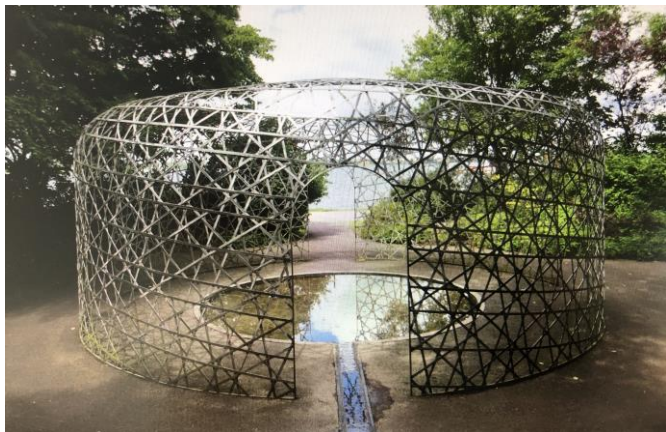
Sådan så pavillonen ud engang.

FBL-Holbæk har henvendt sig til Holbæk Kommune for at få skulpturen bragt flot og med råd om, hvordan man kan forebygge flere ødelæggelser.