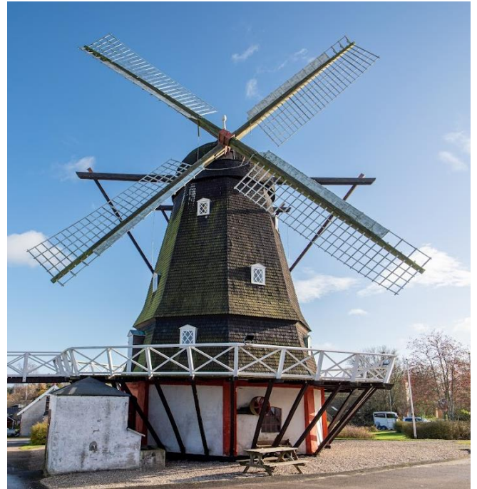
Nr. Jernløse Mølle

FBL-Holbæk inviterer til medlemsudflugt til Nr. Jernløse Mølle søndag den 27. august kl. 13-15. Adressen er Møllebakken 2, 4420 Regstrup. Der vil blive serveret kaffe og kage. For medlemmer er arrangementet uden beregning, for ikke medlemmer koster det 50 kr.