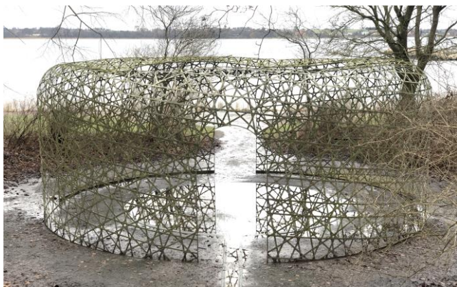
- og sådan ser pavillonen ud i 2023