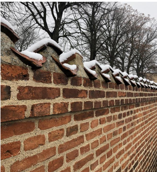
Sct. Nicolai Kirkegårds smukke mur langs Blegdammen