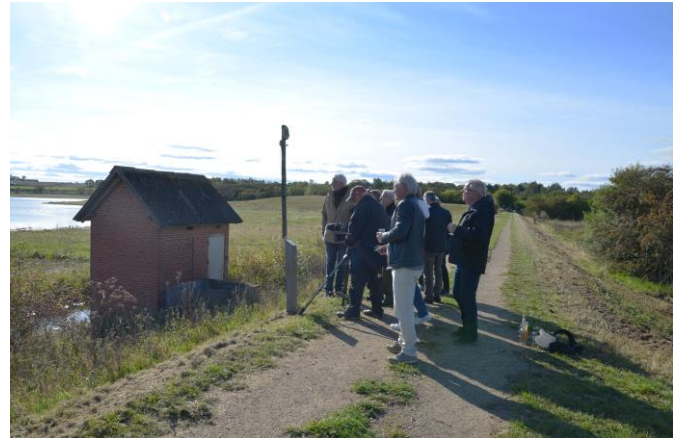
En række medlemmer deltog i præmieringen i 2020 af det nye vådområde i Tempelkrogen med opsætning af en plakette – det er den lille pæl i forgrunden. Pumpehuset til venstre bliver det nye formidlingssted om hele området.

områder og en bemærkelsesværdig biotop: Diget fra landindvindingen i 60érne er bibeholdt og sikrer, at det nye vådområde er ferskvand, Isefjorden er jo saltvand. Det tilfører området en stor mangfoldighed i dyre-planteliv, samtidig med, at det giver offentligheden en unik mulighed for at opleve natur omkring både fersk- og saltvandsområder samtidig og på tætteste hold. Meget hurtigt har forskellige fiske- og fuglearter invaderet området – måske også forskellige vilde dyr. Der er anlagt stier hele vejen rundt om området. Det er en perle og en stor gave til befolkningen her i området...”