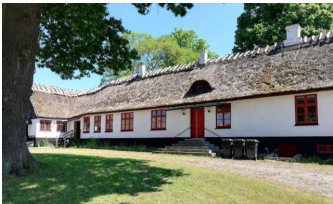
Præstegårdsanlægget set fra gården.

Orø Menighedsråd ansøgte sidste år Holbæk Kommune om tilladelse til at nedrive dele af præstegårdsanlægget ved Orø Kirke med henblik på at opføre en ny præstebolig et andet sted på matriklen.