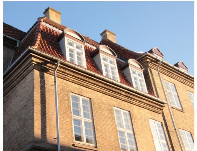
Kasernen har mange fine detaljer som her fra den tidligere administrationsbygning, Kasernevej 6

8. marts havde FBL-Holbæks bestyrelse inviteret repræsentanter fra kommunens plan- og byggeafdelinger og driftsafdelingen samt Holbæk Museum.