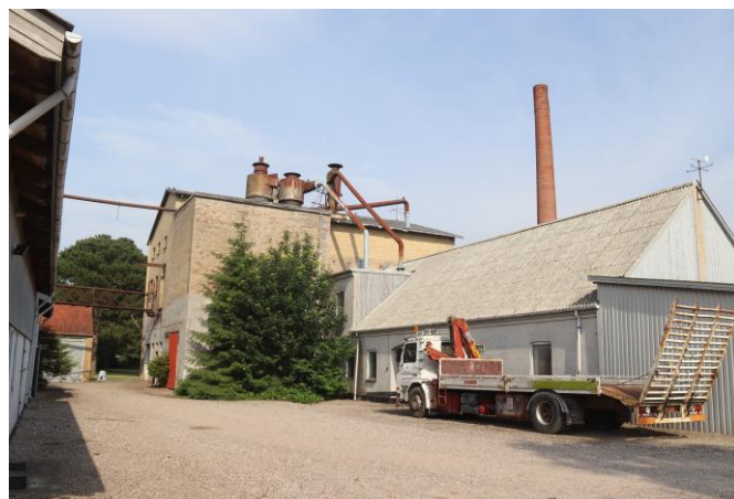
Fra Mørkøv Savværk anno 2022

Savværket lukkede i 2000 men mange af bygningerne er stadig intakte.