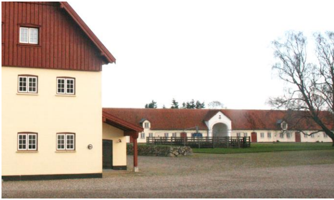
Aggersvold, som det ser ud i dag

Som I måske kan huske fra sidste nyhedsbrev, vil vi fremover få tilsendt ansøgninger om at bygge i landzone, inden tilladelse bliver givet i Holbæk Kommune. Det er i de tilfælde, hvor der er tale om bygningsændringer og -anvendelser af større ejendomme beliggende i de udpegede kulturmiljøer. Aggersvold blev efter dette nye koncept gennemgået på et Team Bevaringsmøde i januar måned. Projektet fik stort set kun rosende ord med på vejen fra os.