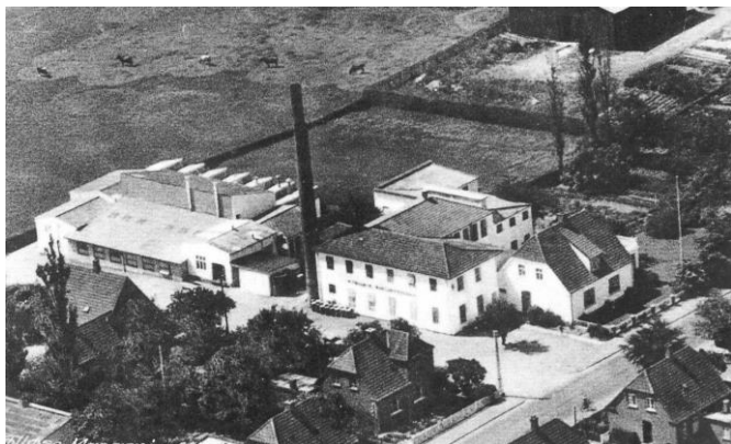
Tølløse Margarinefabrik omkring 1960

Leverede indtil 1991 margarine til bagerier og til fødevarerindustrien.