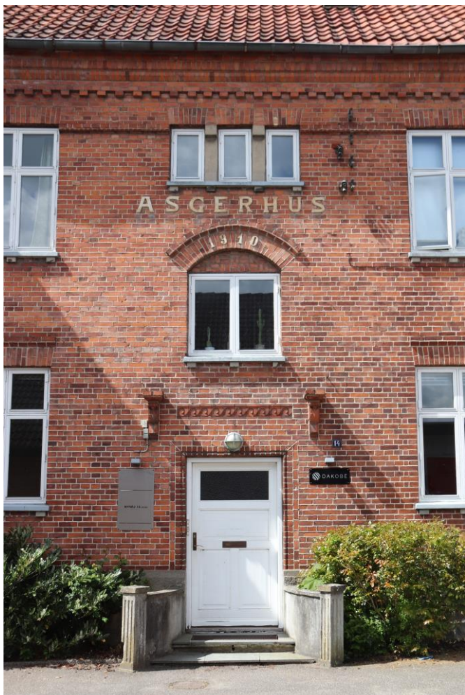
Asgerhus, Nyvej 14 i Jyderup Stationsby opført i 1910

Mødestedet er Bibliotekspladsen, Skarridsøgade 37, Jyderup kl. 10 søndag den 11. september. Der er parkeringsmulighed ved Bibliotekspladsen. Turen varer knapt 2 timer og er på omkring 3 km.