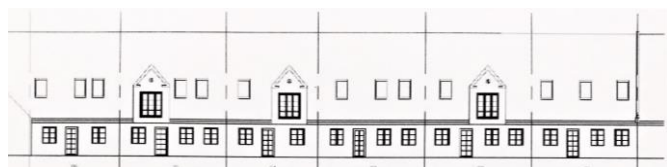
Forslag til facadeændring, som desværre er godkendt som tegnet ved landzonetilladelsen

Vi er af den opfattelse, at ingen af forslagene respekterer de gamle bygningers arkitektur og historie fuldt ud. Vi kunne have tænkt os en dialog med kommunen og gerne også med ejerne, inden tilladelsen blev givet.