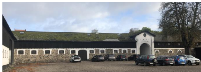
Hørbygaards magasinbygning, som den ser ud i dag

Flere af bygningerne incl. hovedbygningen er erklæret bevaringsværdige.