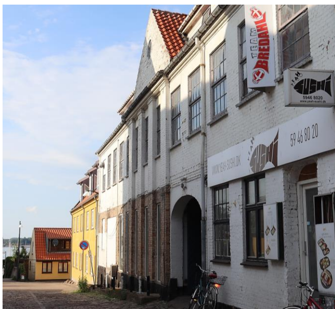
Blindestræde 2A, som kan se frem til en bevarende istandsættelse

Vi anførte videre: ”... FBL-Holbæk så gerne, at vinduesglassene ved en rekonstruktion/restaurering blev sat i linoliekit. De eksisterende vinduesrammer står derimod næppe til at redde, men kan bero på en konkret og nærmere undersøgelse.