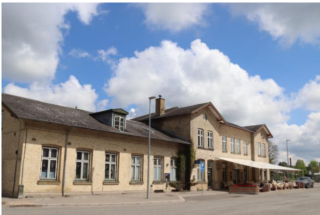
Jyderup Station rummer nu bl.a. Café Forsinket

Vi barsler med at arrangere en tur i sensommeren for alle jer medlemmer til Jyderup, en af kommunens mange stationsbyer.