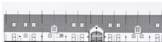
Fint forslag til facadeændring, som dog endnu ikke er godkendt