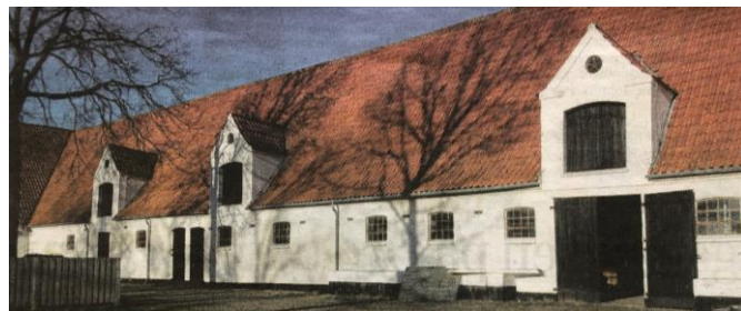
Vognerups ladebygning, som den ser ud i dag.

Vognerup hovedbygning er fra ca. 1565. Den flotte lade er fra 1841.