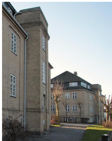
Holbæk Kaserne, når den er smukkest. Den fjerneste ejes af A/B Artillerigården og den nærmeste af Boligselskabet Sjælland. Bygningerne ligger i den nordligste del af kaserneområdet

”FBL-Holbæk har den 6. januar besigtiget kaserneområdet med henblik på at danne sig et overblik over bygningernes ombygninger, tilbygninger