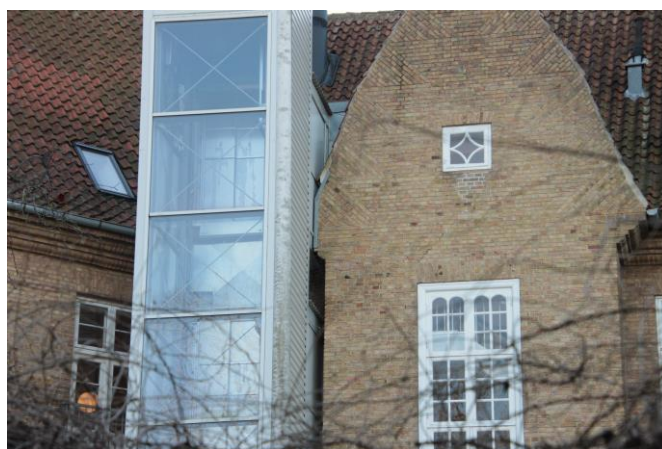
Holbæk Kaserne, hvor det er gået rigtig galt ved placering af en elevator. Bygningen ejes og anvendes af Holbæk Kommune

Ændringer i detaljerne, den ene efter den anden, ender med at fjerne det arkitektoniske og kulturhistoriske udtryk, som oprindeligt gjorde bygningerne bevaringsværdige. De er en del af Holbæks identitet. Det er så afgørende for bygningernes fortsatte kvalitetsmærke, at der er forståelse og indsigt til stede ved enhver vedligeholdelse, renovering og ændring.”