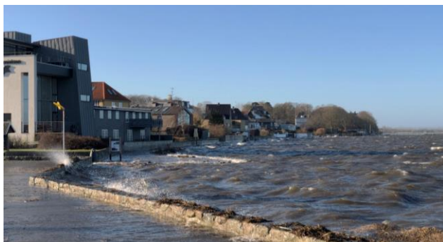
Stormen Malik rasede den 29.-30. januar. Her er det i Holbæk, hvor Fjordstien blev oversvømmet