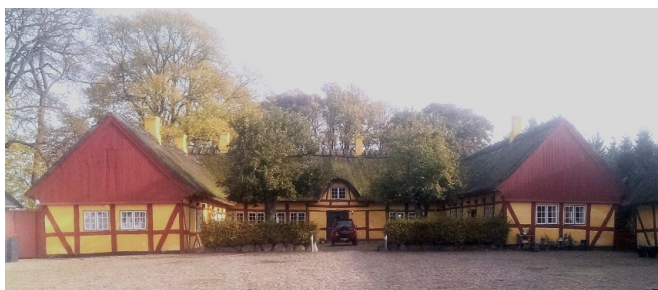
St. Taastrup Præstegård er et typisk sjællandsk bygningsanlæg med smalle længer og bræddebeklædte gavle, oprindeligt dog med overkalket bindingsværk, som var traditionen på Sjælland

På vores kvartalsmøde i oktober i Team Bevaring var St. Taastrup Præstegård et af emnerne: Præstegården, som er fredet, er stærkt angrebet af skimmelsvamp, og på grund af omkostningerne overvejer menighedsrådet at bygge en ny præstegård. Præstegården er én af Sjællands største og ældste præstegårde. Den er opført i 1701.