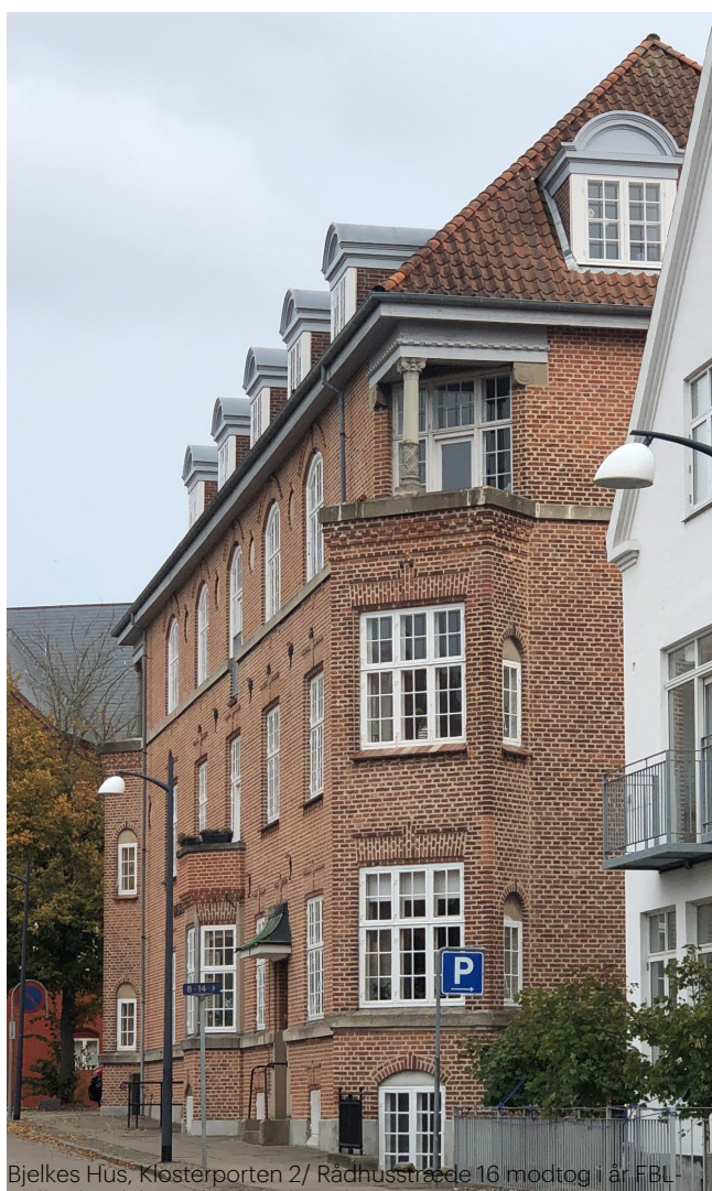
Bjelkes Hus, Klosterporten 2/ Rådhusstræde 16 modtog i år FBL-Holbæks plakette for facaderenoveringen.

En vigtig del af foreningens arbejde er at understøtte vedligeholdelsen af de bevaringsværdige bygninger og landskaber i kommunen.