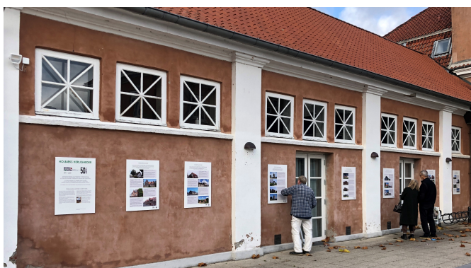
Jubilæumsudstillingen ved Jyderup Bibliotek

Det er som beskrevet i sidste nyhedsbrev en plancheudstilling bygget op omkring forskellige temaer som transformationer af gode bygninger til nye formål, markante produktionsbygninger, husmandsbrug 1800-1920'erne, kulturlandskaber mm.