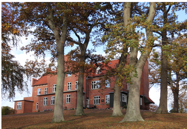
Lerchehuset er opført i 1890 af komtesse Lerche som rekreationshjem "til gavn for mange", som der står på en lille mindetavle på bygningen