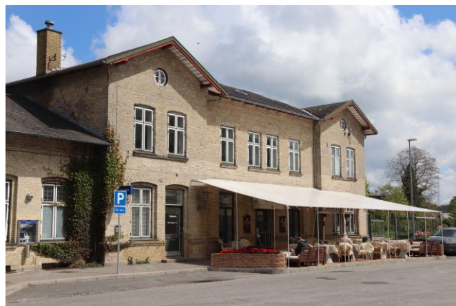
Jyderup Station er allerede blevet begavet med en fin café

Der i screeningen lagt vægt på, at bevaringshensyn vejer tungt i forbindelse med ombygningen. Vi afventer det egentlige lokalplanforslag.