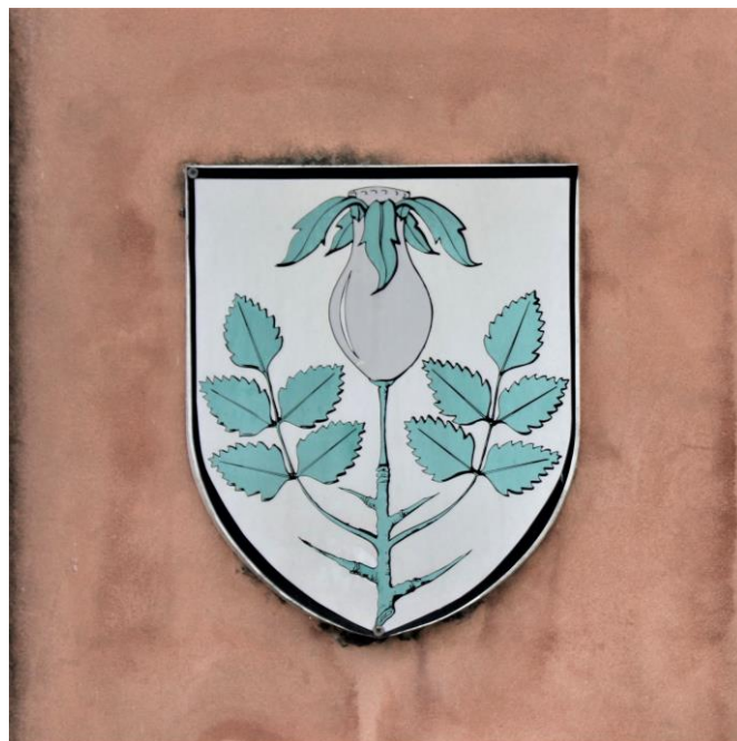
Tornved Kommunes gamle byvåben, som er placeret på en bygning skråt overfor Jyderup Station