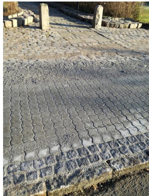
På Isefjordsvej i Holbæk er der lagt coloco-sten på fortovet. Billedet viser fortovet ud for den gamle bygmesterskoles indkørsel.

I løbet af december-januar begyndte fortovsbelægningen på Isefjordsvej at ændre karakter, idet hele strækningen fra Munkholmvej til Strandmøllevej blev belagt med coloco-sten, en betonsten som man ellers fortrinsvis ser som belægning ved busterminaler eller supermarketers parkeringsarealer, hvor der skønnes behov for en solid befæstning af fladen. Vi fandt det temmelig uæstetisk i