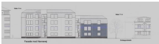
Kommende facade Havnevej 46-48 ifølge lokalplanen

Vi fik forslag til kommentering som teknisk høring forud for fremlæggelse af lokalplanforslaget. Vi foreslog, at bebyggelsens hjørne mod Brolæggerstræde blev ført helt til skel i stedet for at placere en række P-pladser på grunden her. Den ændring kom med i Lokalplanforslaget og i den i marts vedtagne lokalplan