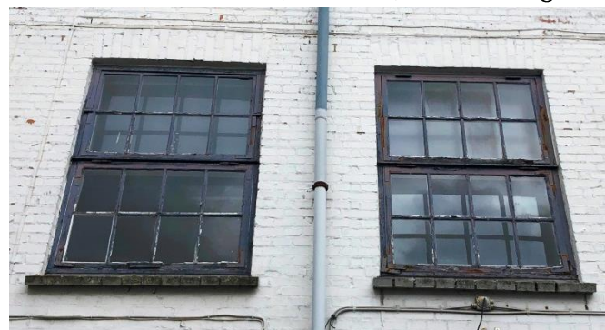
De gamle vinduer er blevet udskiftningsmodne men vil blive genskabt.

Ejendommen er et fint eksempel på et fabriksanlæg, oprindeligt en konservesfabrik, bygget ca. 1918. Nu skal ejendommen istandsættes og indrettes med boliger bortset fra stueetagen, som forbliver erhverv. Projektet, som vi fik tilsendt, ser lovende ud og er med til at give nyt liv til gamle bevaringsværdige bygninger i Holbæk by, både hvad angår arkitektur og kulturhistorie.