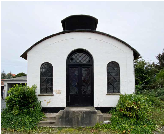
Sofievej 1B, Tølløse. Det gamle elektricitetsværk fra omkring 1900 var en af de præmierede bygninger

Det er Foreningen Historiske Huse, som tog initiativet til præmieringen. Historiske Huse, Holbæk Kommune, Museum Vestsjælland og FBL- Holbæk deltog i nominering og udvælgelse efter indstilling fra kommunens borgere.