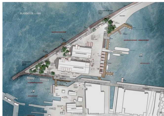
Illustration fra lokalplanforslaget

med over i den gamle havn. Kanalen i lokalplanen indsnævres til en smal sluse, der tydeligvis underlægger sig den gennemgående brede promenade. Hvor er det selvgroede, det kreative og arbejdende miljø blevet af?