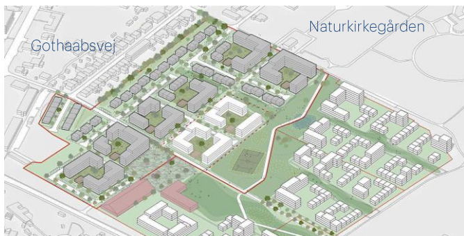
Masterplan for Holbæk Have, de gamle stadionarealer

FBL-Holbæk anbefalede en lavere bygningshøjde for de bygninger der vil komme til at vende mod naturkirkegården og Højen.