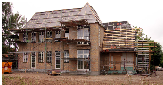
Møllevangen 1 set fra Slåenstien

Jernstøberiet på Lundemarksvej er nu blevet solgt. Ny lokalplan er under udarbejdelse, og flere af de gamle bygninger er allerede ved at forsvinde.