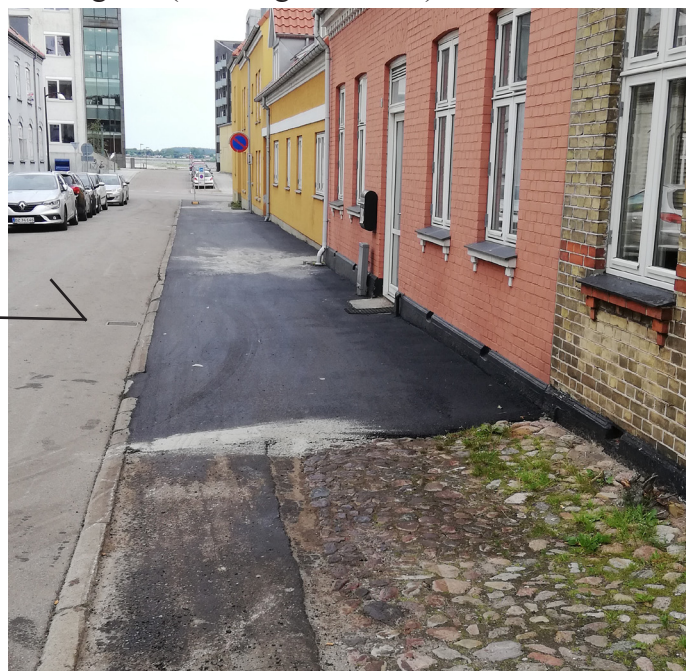
Strandgade ( Øvre og nedre del )

Strandgade er en tidstypisk og smuk gade med en praktisk belægning kombineret med granitsten på den inderste del af fortovet.