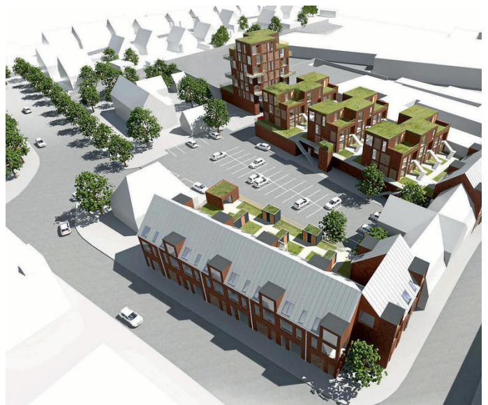
Illustration Kullegaard A/S

Bevaringsforeningen har efter udsendelse af udkast til lokalplan, udtrykt stor betænkelighed ved opførelse af en boligblok på 7 etage, på den del af grunden der ligger umiddelbart bag ved "Borgerstiftelsen", som er den ejendom der ligger syd for Markedspladsen, og som vil blive påvirket katastrofalt af skygger og indblik fra en ny høj bygning.