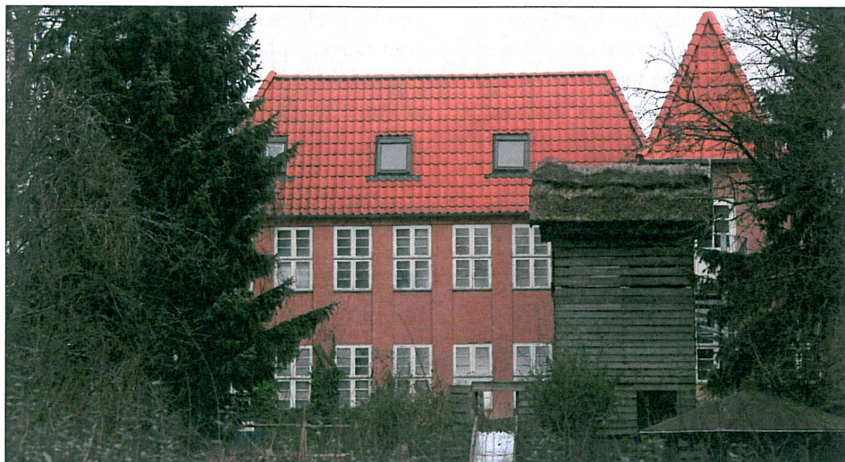
Møllevangen 1 - set fra vejen.