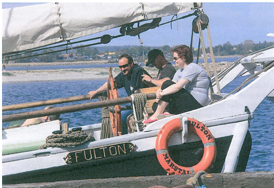
Endnu et billede fra pinsens træskibstræf: Skonnerten Fulton af Marstal var også med.