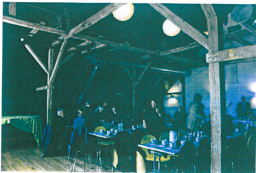
Huset på Næsset, Teatersalen. 23.03.2013.