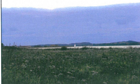
Foto nedenfor: Strandengen ved Holbæk Fjord/ Strandmøllevej, 2010.08.09.

For- og bagsidefoto: Eriksholm Skov ved Bramsnæs Bugt. Nytårsdag 2011. 2011.01.01.