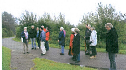
Foto nedenfor: Et udsnit af deltagereskaren uden for observatoriekuplerne.

Foto tv.: Et af Brorfeldes mange spændende rum. Der var ikke mange dele af bygningsanlægget, der undgik deltagerernes opmærksomhed ved den meget fine gennemgang på Bygningskulturens Dag.