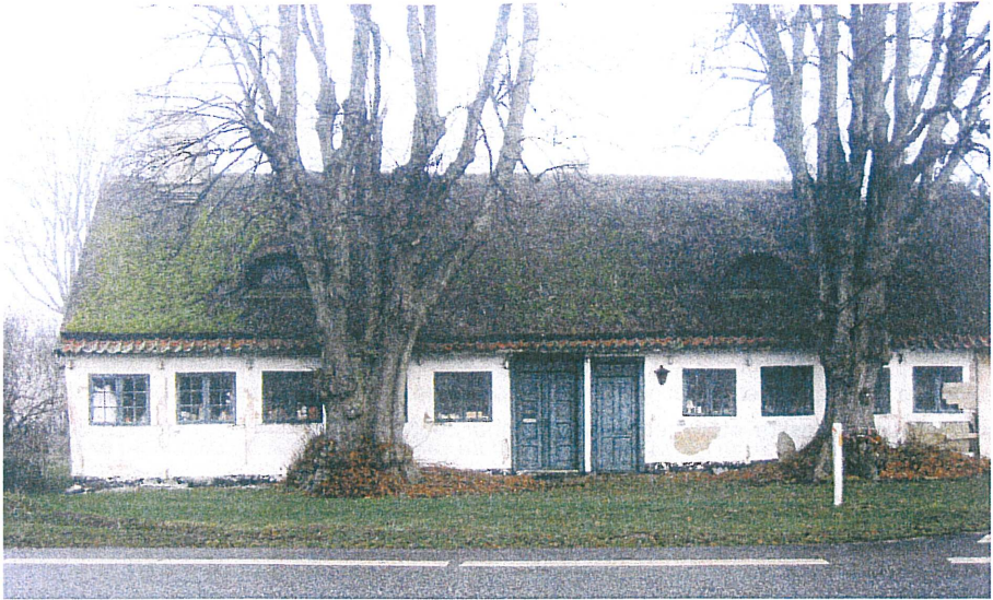
Tuse Gl. Kro set fra vejen. Th. i billedrammen øverst anes det beskadigede hjørne, der, som det fremgår nedenfor i det mere detaljerede billede, kun er så nødtørfigt udbedret, at det gør ondt.