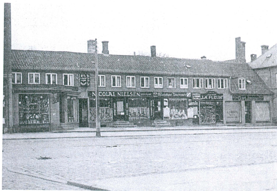
Øverst: Lassens Gård set fra nordsiden af Ahlgade, u.å.. Fot.: Det Lassenske Billedarkiv Nedenfor: Lassens Gård set fra Bagstræde, u.å.. Fot.: Det Lassenske Billedarkiv