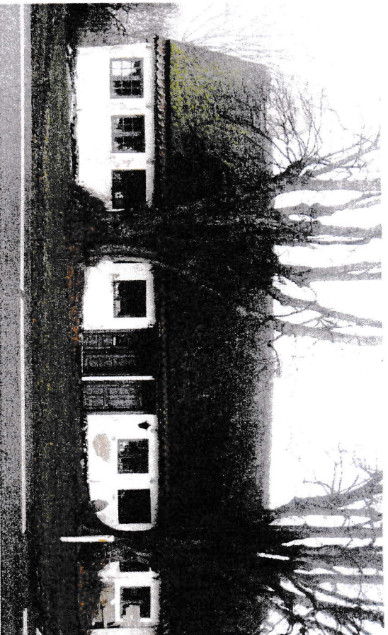
Tuse G1. Kro set fra vejen. Th. i billedrammen øverst anes det beskadede hjørne, der, som det fremgår nedenfor i det mere detaljerede billede, kun er så nødtørftigt udbedret, at det gør ondt.