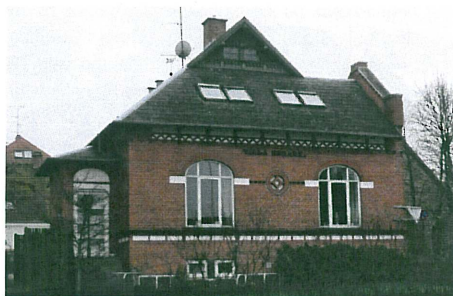
Villa Esmark. Denne byggestil, noget inspireret af opfattelsen af vikingetid iblandt centraleuropæisk inspiration, er der flere eksempler på, den var meget tidstypisk.