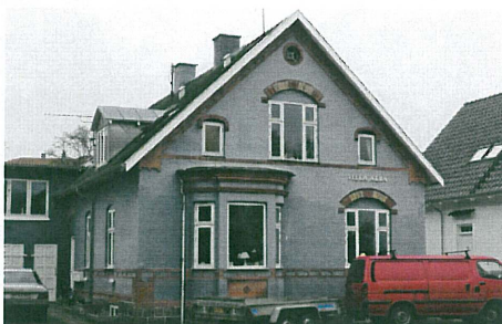
Lidt længere ude ad vejen er Villa Alba i hvert fald ikke hvid længere.