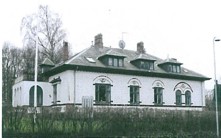
Den første villa på Kalundborgvej, nr. 71. Villaen er faktisk ikke så stor i forhold til den store børneskole, som flyttede med fra Ahlgade.