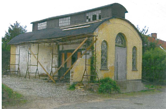
Fot.: Vivi Rudbæk Lausen, august 2006.

bør projektet fremtidssikres og gennemtænkes nøje, inden det vedtages, og der bør tages hensyn til såvel kulturarv som borgernes øvrige velbefindende. Prisen bør ikke være det altafgørende.