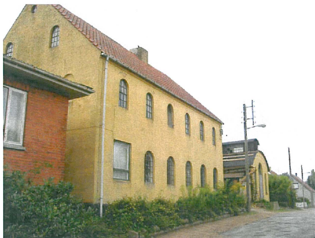
Fot.: Vivi Rudbæk Lausen, august 2006.

Desværre er et af vinduerne i maskinhallen på et tidspunkt blevet udskiftet med et moderne vindue i stedet for de gamle jernvinduer. Tilsyneladende er det svært at finde et andet vindue, så løsningen bliver måske at tilmure vinduet, så facaden alligevel fremtræder ensartet.