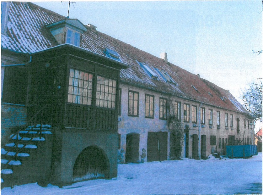
Søstrenes Gård, Ahlgade 13, renoveres og ombygges ved hjælp af Byfornyelsesmidler på ca. 16 mill. kroner. Gårdens fremtid synes således sikret.