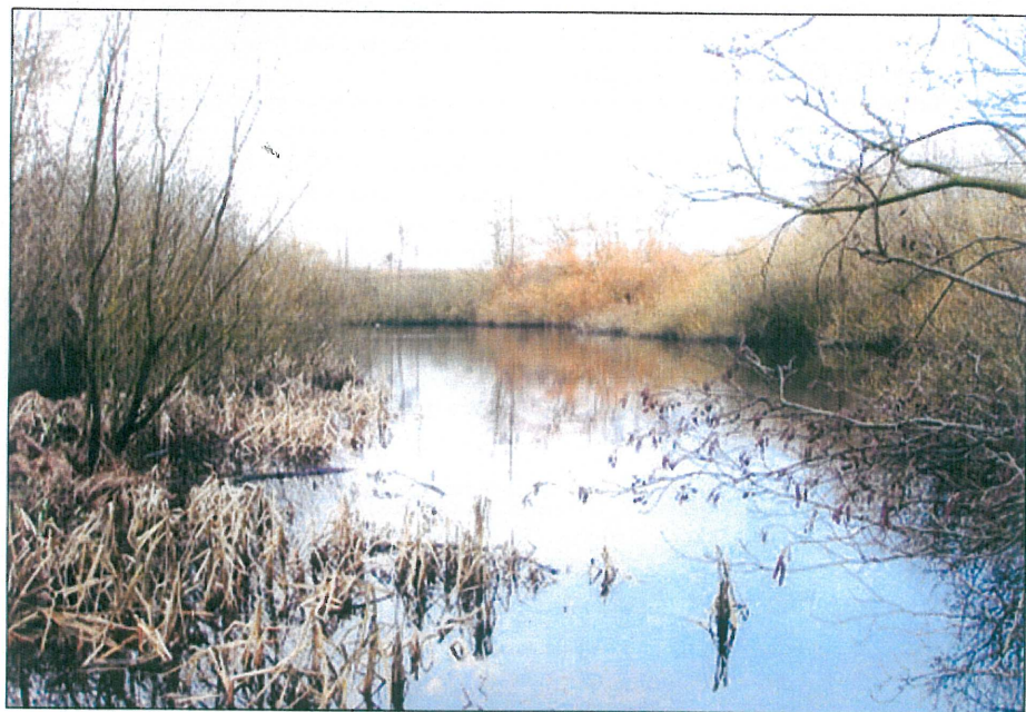
Wegenersminde med tilhørende sø i haveanlægget.