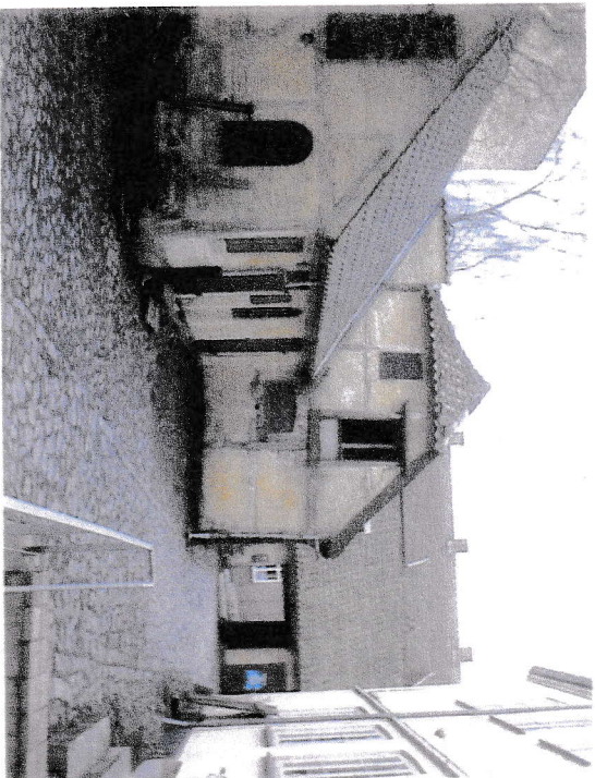
Gårdmiljø i Bryggergården i Kirkestræde